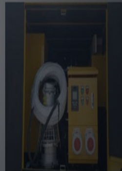
The submersible pump has high flow rate, high efficiency, light weight, and small volume; the water pump control cabinet can accurately control the flow rate, and has multiple protection functions.